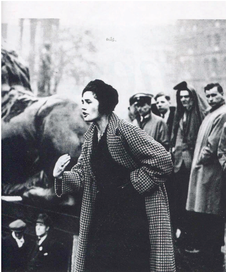
La députée travailliste Jennie Lee (1904-1988) débat ici en public à Trafalgar Square.