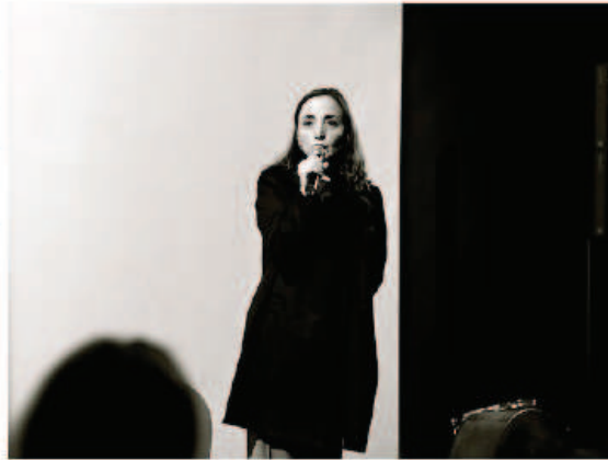
The French actress Dominique Blanc at the 5x15 event in Paris in May.

PARIS — "In the future," Andy Warhol immortally said in 1968, "everyone will be world-famous for 15 minutes."